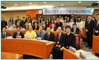
圖說：香港中文中學聯會臺灣升學考察團參觀訪問亞洲大學，與會師生一同合影。

香港中文中學聯會臺灣升學考察團將辦學績優、師資陣營堅強的亞洲大學，列為訪察的必要行程。